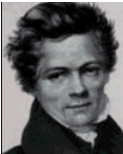
Adolphe Monod quand il est jeune

Bien qu'Adolphe Monod appartienne à une famille de ministres protestants, sa naissance à la foi n'en est pas pour autant facile. Il endure des luttes longues et pénibles avant de comprendre le message et la puissance de l'Évangile et d'embrasser la foi évangélique qu'il pressentait, depuis longtemps, être vraie.